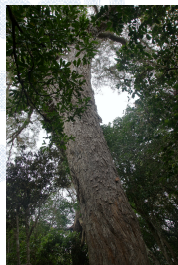
Tamarin des hauts